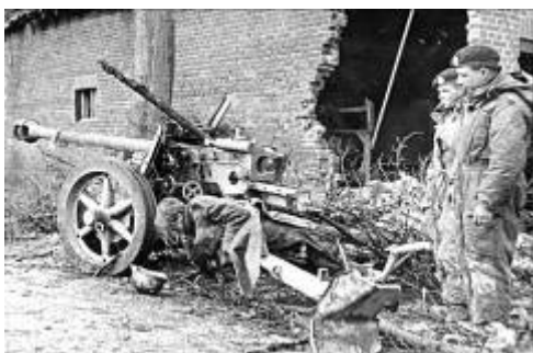
Dode Duitse soldaat bij kruispunt Pey

Mathijs Schulpen was veehandelaar en Café baas. Hij is twee dagen na de bevrijding bij granaatbeschieting van het kruispunt aan de Rijksweg in Pey nog dodelijk verwond.