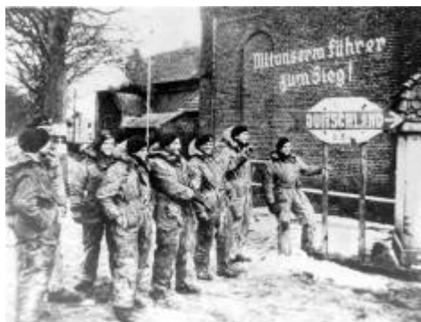
Korte rustpauze aan de Rijksweg Pey voor de bevrijders.