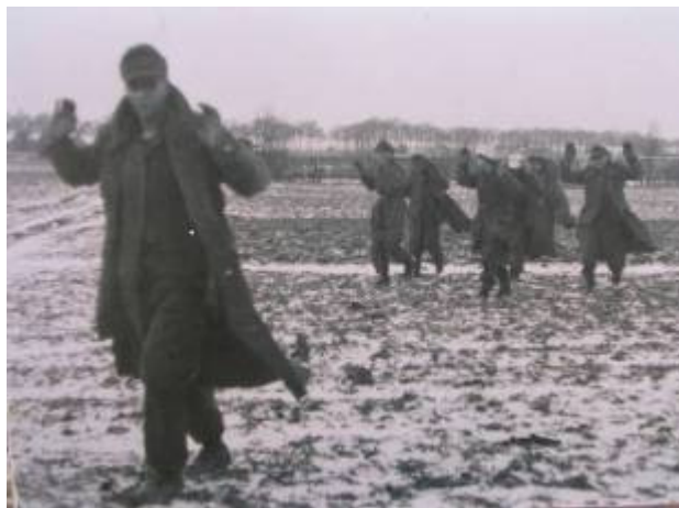
Duitse Falschirmjäger in het veld tussen Hingen en St. Joost die zich, op nadrukkelijk verzoek en smeekbeden van de burgers overgaven, hierdoor werden veel burgerlevens in de schuilkelders gered van de vlammenwerpers