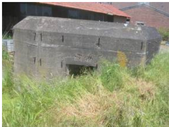
Kazemat achter de boerderij Wolters