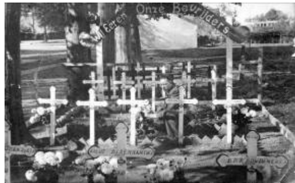
Noodkerkhof nabij Kapel van Schilberg