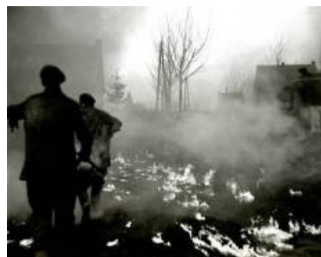
Gevechten op de St. Joosterweg op 21 januari 1945

Op de website Pejjerlandj.nl , die opgestart is door Thei Golsteijn in 2006, zijn in de loop der tijd een aantal oorlogsverhalen vastgelegd door René Rutten. En vanuit deze gegevens is de compilatie gemaakt van de 45 oorlogsslachtoffers in onze parochie.