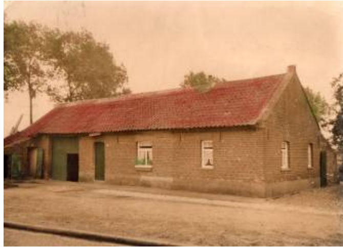
Het woonhuis met schuur van de fam. Graus In de Planten Hingen

Men heeft hem los moeten bikken om het lijk te kunnen meenemen en dat heeft toen enkele dagen bij de familie Graus in de schuur gelegen.”