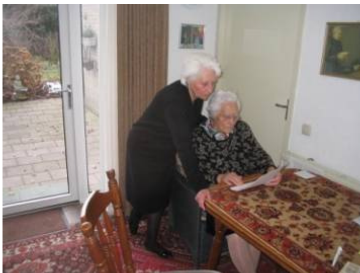
Tant Nèske en Trineke controleren op Patriciushof 5 het verhaal voor Pejjerlandj

De oorlog was voorbij maar de ellende voor de familie nog niet zoals in vele gezinnen waarin de vader, als kostwinner, in de oorlog het leven had gelaten.