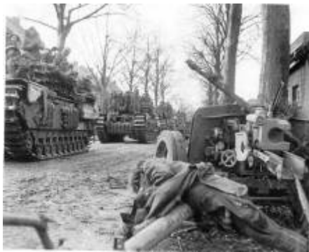
Bosstraat Schilberg 20 januari 1945

Graad was het eerste slachtoffer in Pey dat dodelijk getroffen werd door granaatvuur van de geallieerden vanuit Susteren. Aangezien de granaatbeschieting geheel onverwacht plaatsvond had hij geen dekking kunnen zoeken en werd op slag gedood. Hij woonde in het pand op de Bosstraat te Schilberg, waar naderhand de friture van “Fin van Simons” werd gevestigd. Hij liet een vrouw met vier kinderen na.