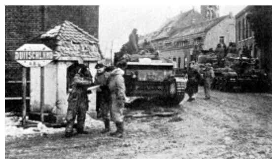
Stafoverleg op hoek Houtstraat Rijksweg

Het kruispunt was strategisch gezien erg belangrijk vandaar dat er ook zo fel gevochten is, waardoor de opmars van de geallieerden een dag stagneerde